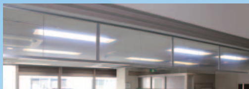
[半透明不燃シート]